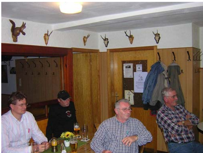
Einige der Teilnehmer an der Versammlung im Gasthaus