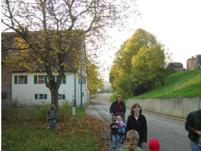
Die Nachhut beim Ortsrundgang auf dem Weg zum Ortsende im Osten